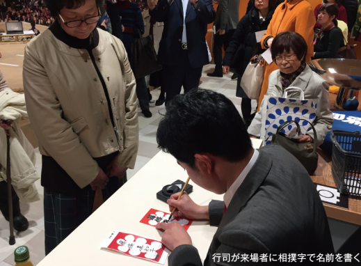
行司が来場者に相撲手で名前を書く