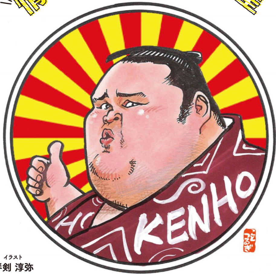
イラスト 琴剣 淳弥