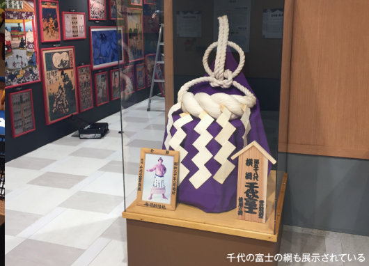
千代の富士の綱も展示されている