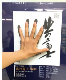
両国駅にて、北の富士さんの手形に重ねてみる

せつかく国技館へ行くなら少し早めに行つて、歴代の収蔵写真や特別展を見てほしい。国技館だけに保管されているレアな力士の写真や、優勝力士ゆかりの品物が展示されており見応えがある。あ、一階の三〇〇円相撲部屋直伝ちゃんこもお忘れなく。