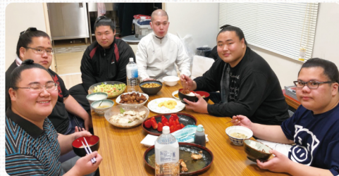
メニュー・鳥のスープだし・卵焼き・サラダ・照焼きチキン