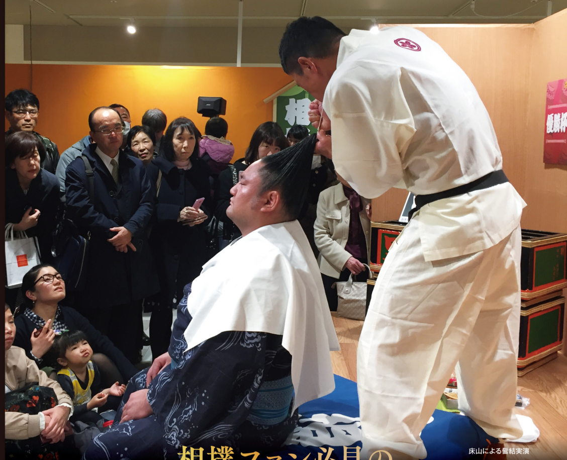
床山による齋結実演