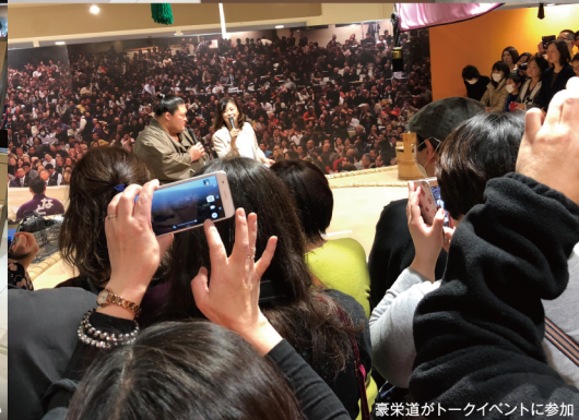
豪栄道がトークイベントに参加