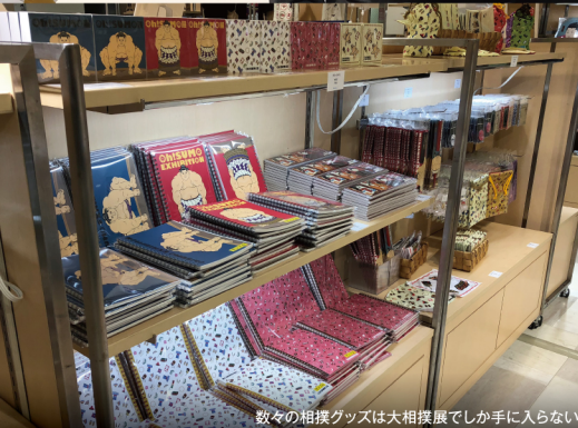
数々の相撲グッズは大相撲展でしか手に入らない