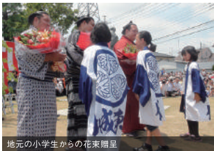
地元の小学生からの花束贈呈