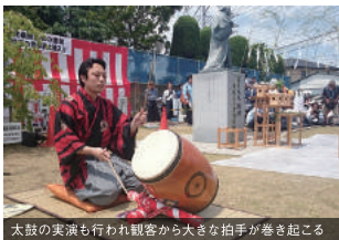
太鼓の演奏も行われ観客から大きな拍手が巻き起こる