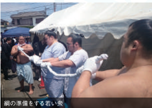
綱の準備をする若い衆