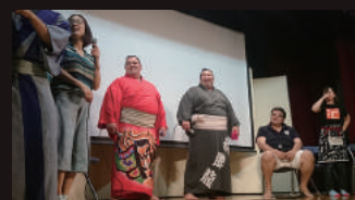
関取の登場で会場の盛り上がりは最高潮に

相撲人気が高まるなかで乱立する相撲のトークイベント 初回の抱きしめてツナイト開催が4年前 それよりも前に始まった相撲トークイベントがうっちゃりトークだ いったいどんな内容なのか？潜入取材を試みた