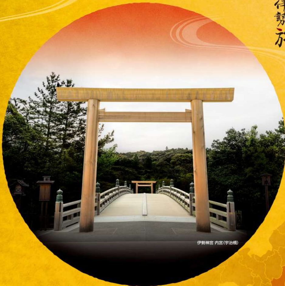
伊勢神宮 内宮(宇治橋)