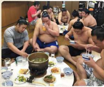
メニュー：牛肉と茄子の煮浸し・鯖の南蛮つけ・二郎玉・とりしお鍋